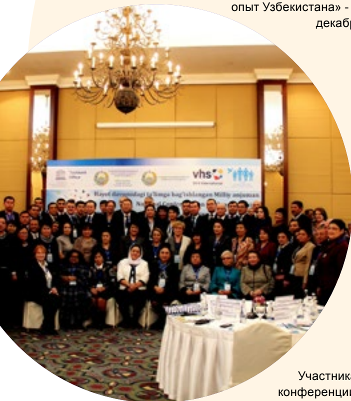
Участниками конференции были члены Сената и Парламента, руководители

14-15 декабря 2017г. в г. Ташкенте Представительством ЮНЕСКО в Узбекистане, Филиалом DVV в Узбекистане в сотрудничестве с государственными и негосударственными партнерами, проведена Национальная конференция по вопросам образования на темы: «Переосмысление образования в контексте текущей реформы в Узбекистане: политика, качество и обучение на протяжении всей жизни» - 14 декабря, и «Центры обучения местных сообществ (ЦОМС): международные тенденции, национальный контекст и опыт Узбекистана» - 15 декабря.